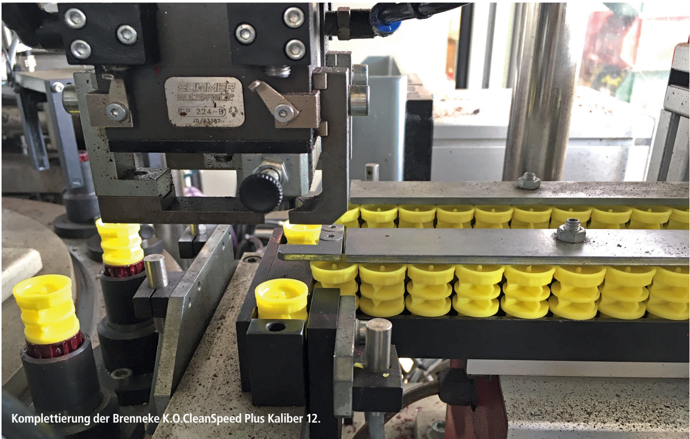
Kompletierung der Brenneke K.O. CleanSpeed Plus Kaliber 12.