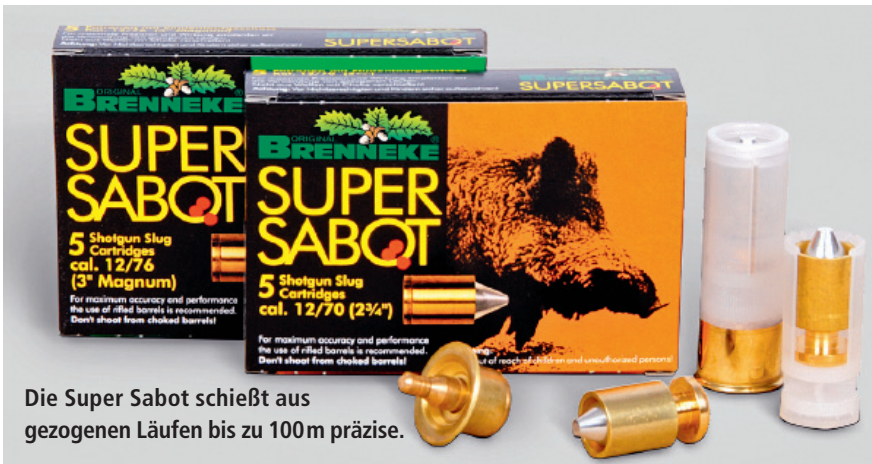
Die Super Sabot schießt aus gezogenen Läufen bis zu 100m präzise.