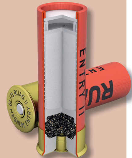
Das Breacher-FLG „Entry II“ von RUAG Ammotec aus gepresstem Zink-Pulver.