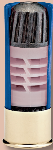
Ein typischer Foster-Slug 12 2 3 / 4 , hier aus der Munitions-Reihe American Gunner.