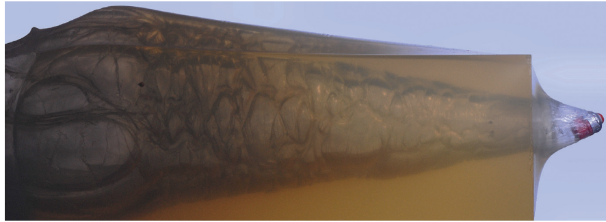
Ein Brenneke Special Forces durchheilt einen 40-cm-Gelatineblock.