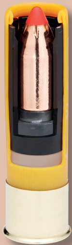
Ein unterkalibriger SST-Sabot Slug von Hornady, hier im Kaliber 20/70.