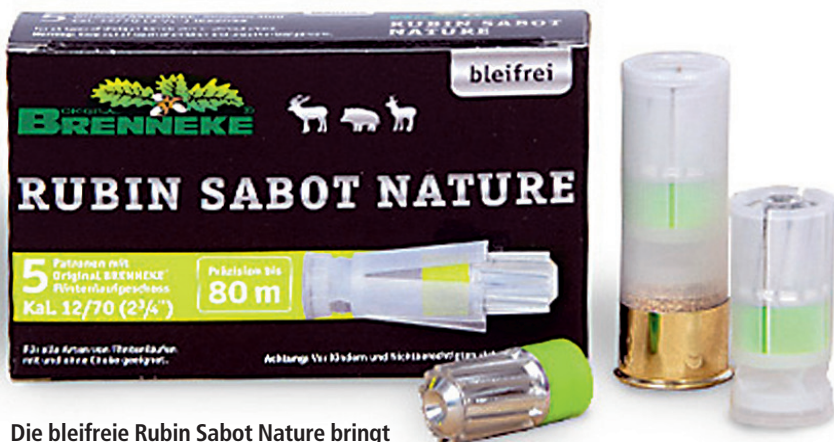
Die bleifreie Rubin Sabot Nature bringt auf 50m mit 1888 Joule 10 Prozent mehr Leistung als eine Brenneke Classic im Kaliber 12.