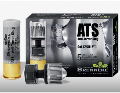
Der Anti Terror-Slug bringt an der Mündung 3578 Joule.