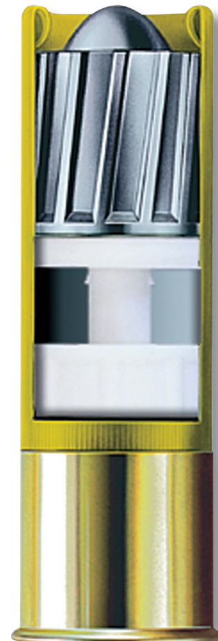
Brenneke SuperMagnum im Kaliber 20.

Dies bedeutet einen um 21,8 Prozent höheren Impuls. Selbst beim Vergleich von der 9,3 x 62 mm (19-g-TUG) und der 39,0 g Brenneke SuperMagnum schneidet letztere auf 25 m mit 14,94 \text{ kg} \times \text{m/s} gegenüber 13,78 \text{ kg} \times \text{m/s} mit einem Plus von 8,4 Prozent besser ab: Die Auftreffenergie ist je nach Modell bis zu einer Entfernung von circa 50 m höher als die der Kugel. Der zweite Grund liegt in der Art der Energieabgabe im Ziel. Während sich das TUG mit einem Durchmesser von 7,82 mm erst mit Verzögerung aufpiltzt, stanzt das Classic-FLG einen Schusskanal von 18,5 mm Durchmesser, verformt sich aufgrund der Bleilegierung nur geringfügig und gibt so gut wie keine Splitter ab. Dadurch hat es eine gewaltige Sofort- und Tiefenwirkung mit Ausschuss – ohne nennenswerte Zerstörung des Wildbrets. Beide Faktoren spielen gerade bei Drückjagd, Nachsuche und Fangschuss eine erhebliche Rolle. Vor dem Hintergrund des jagdlichen Erfolges mit der Brenneke stellt sich die Frage des