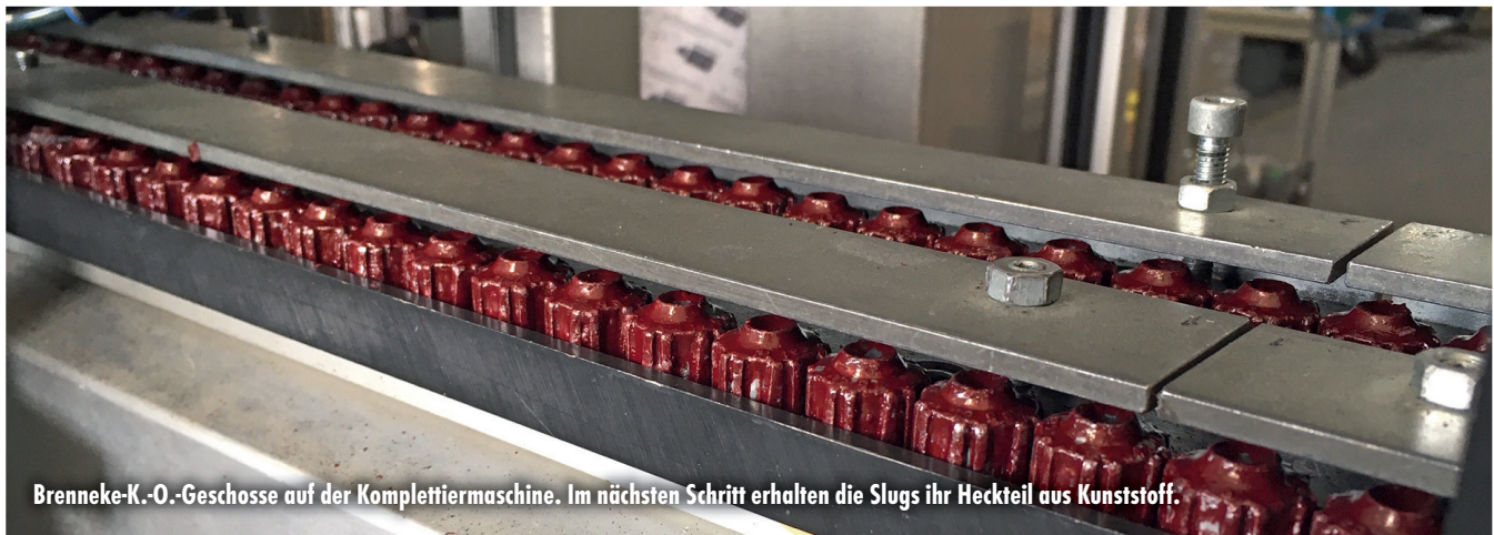
Brenneke-K.O.-Geschosse auf der Komplettiermaschine. Im nächsten Schritt erhalten die Slugs ihr Heckteil aus Kunststoff.